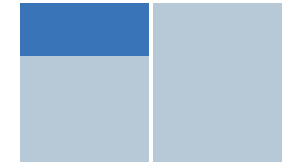
Drittel Seite (1/3) 565 €