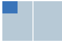
Sechstel Seite (1/6) 360 €