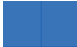
Doppelseite (2/1) 2.400 €