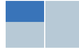
Halbe Seite (1/2) 870 €