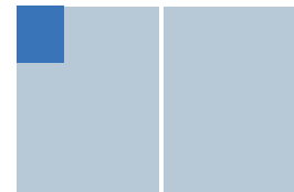
Neuntel Seite (1/9) 205 €